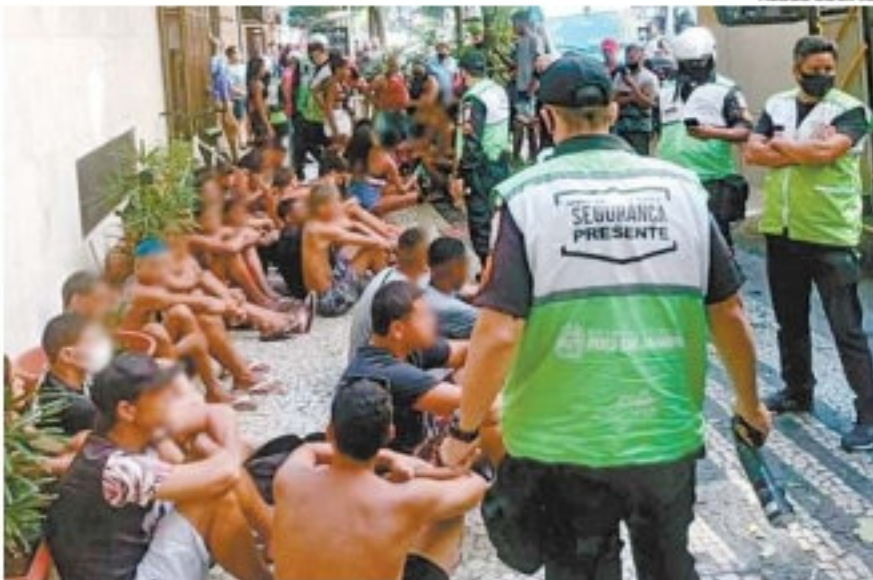
Agentes do Copacabana Presente fizeram ônibus da linha 474 parar