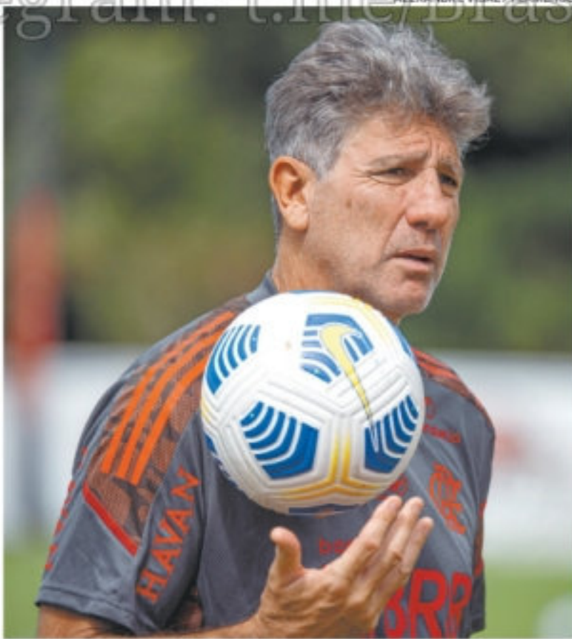
O técnico Renato Gaúcho vira o foco para a Copa do Brasil

■ A fase do Vasco não é boa. O Cruzmaltino acumula três derrotas nos últimos três jogos da Série B do Campeonato Brasileiro e o técnico Lisca não consegue encontrar alternativas para uma mudança de chave. O que pode servir como esperança para o vascaíno é que a sequência pode ser boa para o Vasco. O time de Lisca encara a Ponte Preta e o Brasil de Pelotas, duas equipes da parte de baixo da tabela, em sequência, em São Januário.