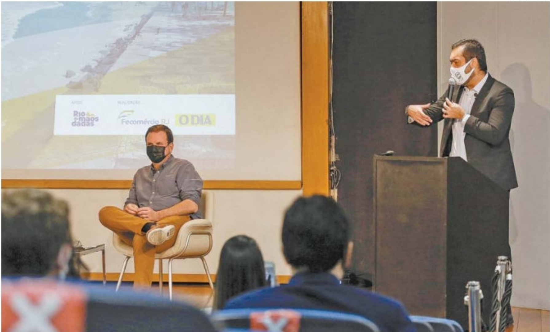
Primeiro dia da terceira edição do Movimento Rio em Frente contou com a presença do governador Cláudio Castro e do prefeito Eduardo Paes

“As medidas que estamos tomando são sustentáveis e vão na direção certa, tanto no município quanto no estado”, afirmou Eduardo Paes, ressaltando a importância entre a união entre os dois níveis de governo (prefeito e governador).