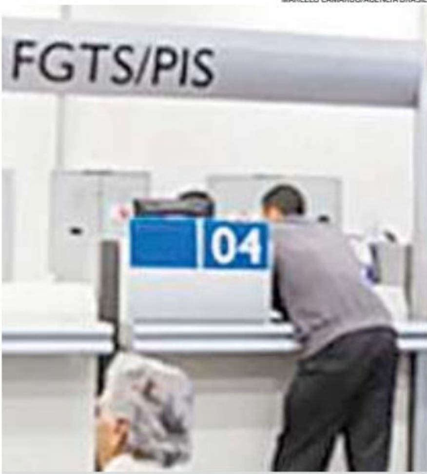
Trabalhador pode acessar o aplicativo FGTS com cadastro e senha

A Caixa reforçou, ainda, que todos os trabalhadores terão