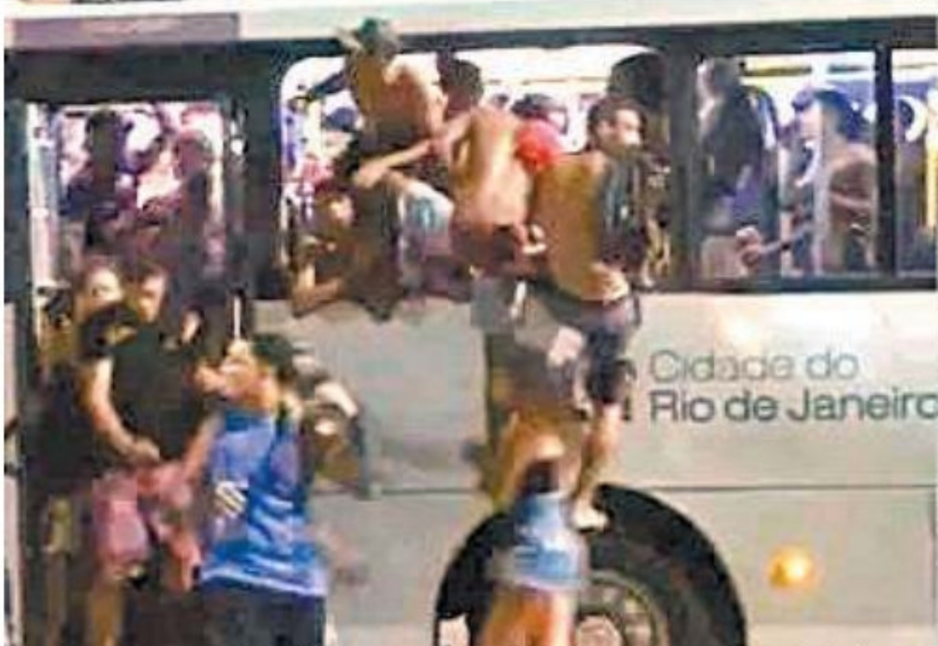
Cenas lamentáveis. Segundo a Rio Ônibus, os episódios de vandalismo resultaram em prejuízo de R$ 100 mil

No sábado, moradores de Copacabana flagraram um grupo de jovens causando confusão em ônibus da linha 474. Após a denúncia de um pedestre, agentes do Copacabana Presente fizeram o veículo parar e abordaram o grupo. Várias pessoas foram revistas na calçada.