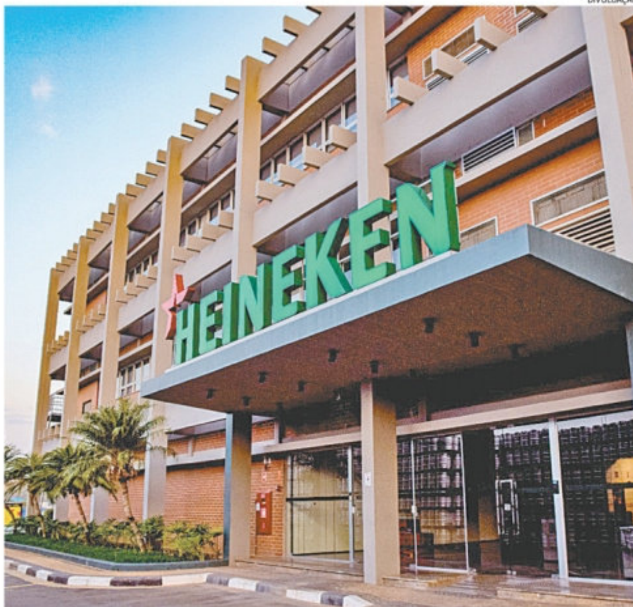
Segunda maior cervejaria do país, grupo Heineken tem inscrições abertas para o Programa Trainee 2022

O Programa Leadership Experiences tem como objetivo desenvolver profissionais para que eles se tornem os futuros líderes da companhia.