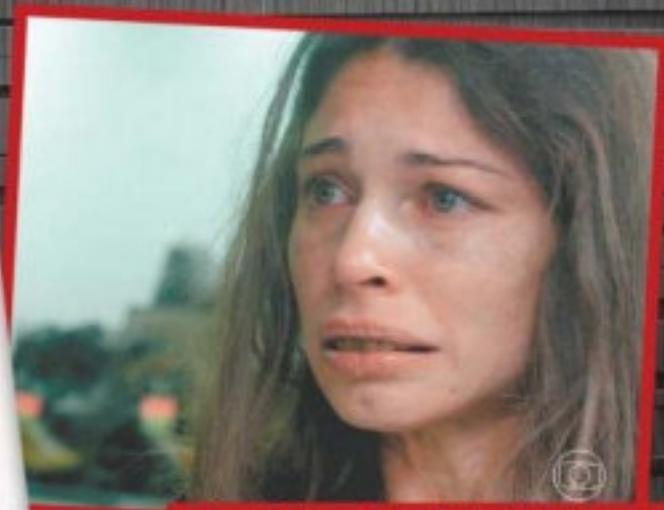
Grazi Massafera foi indicada ao Emmy Internacional por seu papel em ‘Verdades Secretas’