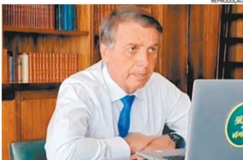
Bolsonaro disse que vai se reunir com o ministro Queiroga