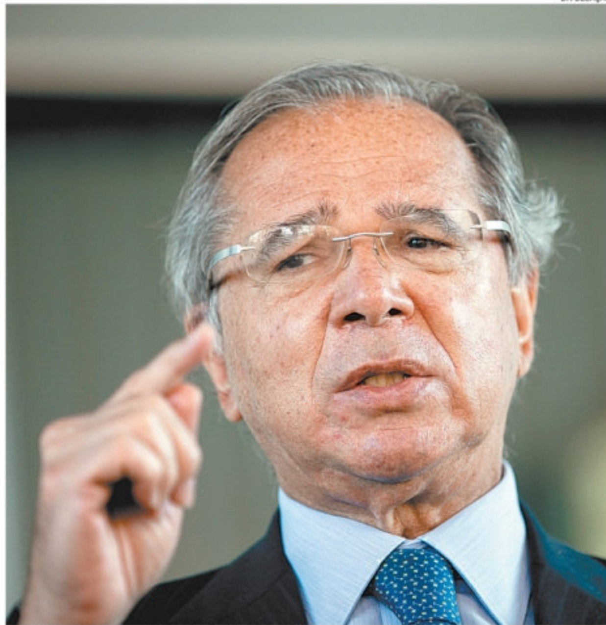
O ministro da Economia, Paulo Guedes, é convidado para audiência pública sobre IBGE

A suspensão do censo demográfico em 2021 trouxe prejuízos para o esforço de atualização das políticas públicas a serem adotadas daqui para frente. O último foi em 2010. O desapontamento dos técnicos levou à demissão de dirigentes. A direção nacional do Instituto confirmou que o IBGE se prepara para a realização do censo demográfico a partir de 1º de junho de 2022. No entanto, a data seria apenas uma previsão e ainda precisará ser confirmada junto ao governo.