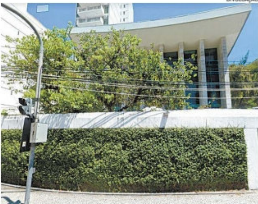
Criminosos postaram mensagens com ameaças a judeus