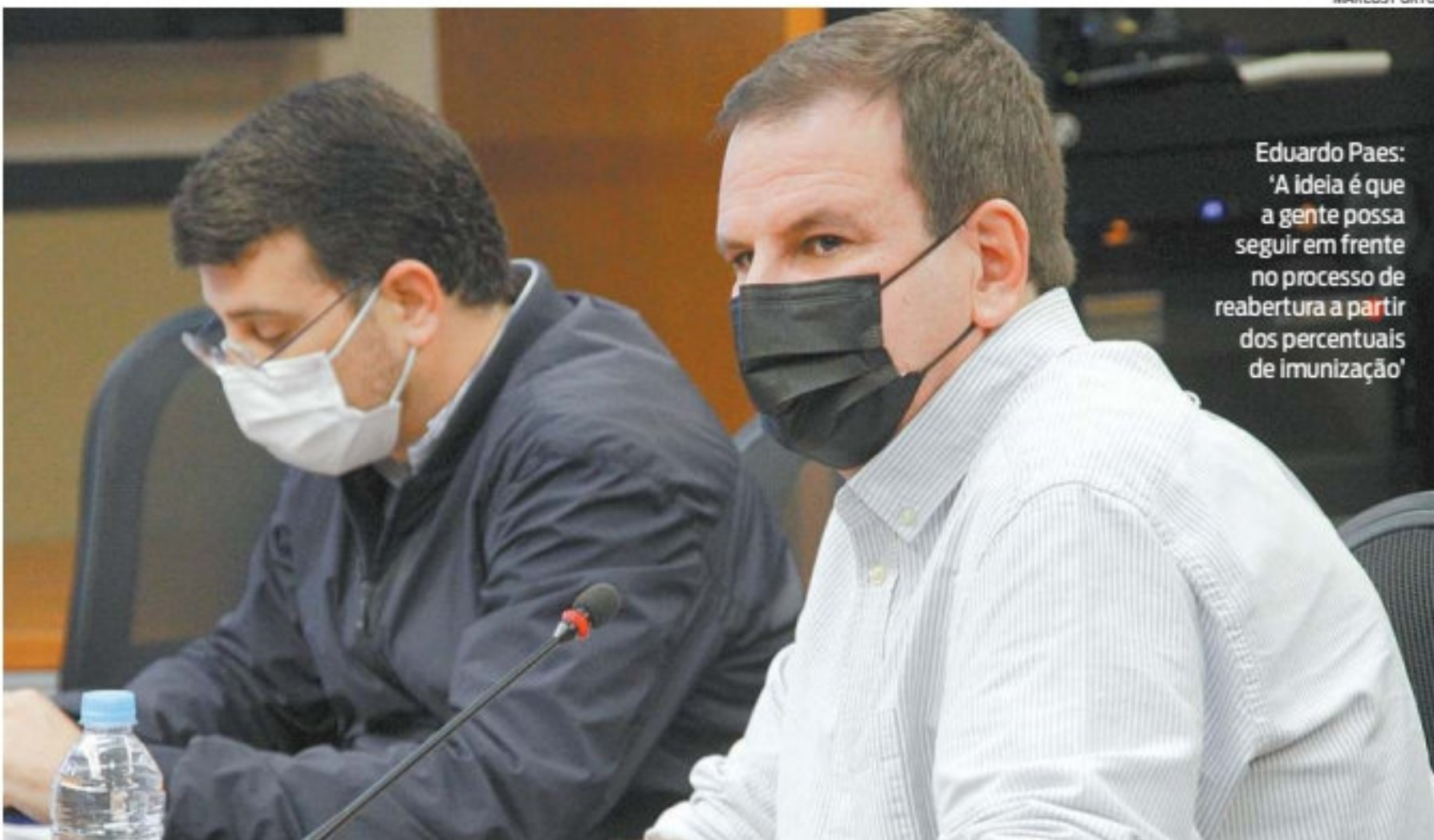
Eduardo Paes: ‘A ideia é que a gente possa seguir em frente no processo de reabertura a partir dos percentuais de imunização’

O prefeito do Rio, Eduardo Paes, afirmou ontem que planeja iniciar o plano de flexibilização das restrições na cidade a partir de setembro, como a iniciativa já estava programada pelo município. O aumento da circulação da variante Delta fez com que o político, na última semana, colocasse a reabertura em ‘stand-by’, mas o avanço da imunização, segundo Paes, dá garantias, na avaliação dela, de melhora na situação epidemiológica. A primeira etapa do plano de reabertura anunciado em julho previa para 2 de setembro as seguintes flexibilizações: eventos em ambientes abertos, com máscara; público de 50% nos estádios (o que já está descartado); público vacinado de 50% em dance-terias, boates e casas de show. “Não sei se exatamente no dia 2, como previsto, mas a partir do mês de setembro a gente começa a atingir determinados marcos de uma fase, que nós entendemos como necessárias, de fim das restrições. Cada vez mais forçando aspectos terapêuticos, como o atendimento à população que for atingida para evitar que mortes aconteçam. Mas a ideia é que a gente possa seguir em frente no processo de reabertura a partir dos percentuais de imunização”, afirmou Paes durante o evento ‘Movimento Rio em Frente’, da Fecomércio, realizado em