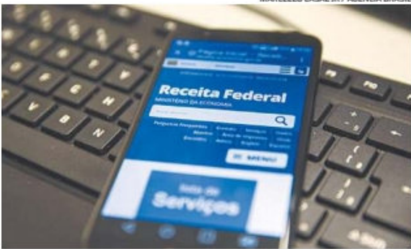
Contribuinte deve acessar http://idg.receita.fazenda.gov.br

Para saber quanto receberá a mais, o trabalhador precisa multiplicar o saldo da conta no dia 31 de dezembro de 2020 por 0,01863517. Se o beneficiário tivesse o saldo de R$ 2 mil, por exemplo, ele receberia R$ 37,28 de lucro. Se tiver R$ 3 mil, vai receber R$ 55,92 a mais. Caso tenha R$ 4 mil, entrará R$ 74,56 na conta e assim por diante.