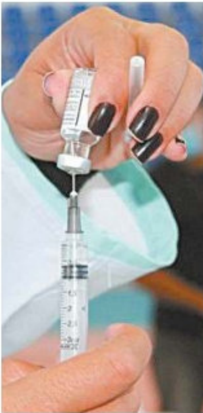
Grupo receberá vacina da Pfizer

em crianças e adolescentes é causada por doenças que não são a covid-19. Apesar disso, para crianças com mais de cinco anos, a principal causa é doença causada pelo coronavírus. Cinco crianças entre cinco e nove anos morreram no estado. Já 45 adolescentes entre 10 e 19 anos morreram, sendo o grupo que mais apresenta comorbidade. Nesta faixa etária, a obesidade e as doenças neurológicas são as mais frequentes.