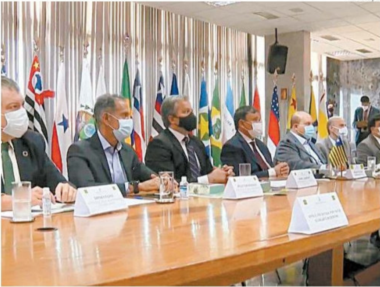
Reunião de governadores debate o clima de tensão no país: tentativa de marcar audiência com Bolsonaro

Para sair do impasse e não deixar de mandar uma clara mensagem de insatisfação ao presidente, a ideia de marcar uma agenda com Bolsonaro e com os outros representantes de Poderes foi proposta pelo governador do Pará, Helder Barbalho (MDB). A sugestão foi tratada como uma espécie de tentativa final de restabelecer alguma normalidade no país e que poderá servir para que Bolsonaro tenha uma espécie de “safada honrosa” para recuar dos ataques que vem fazendo contra ministros do Supremo Tribunal Federal (STF) e das suas ameaças às eleições do próximo ano.