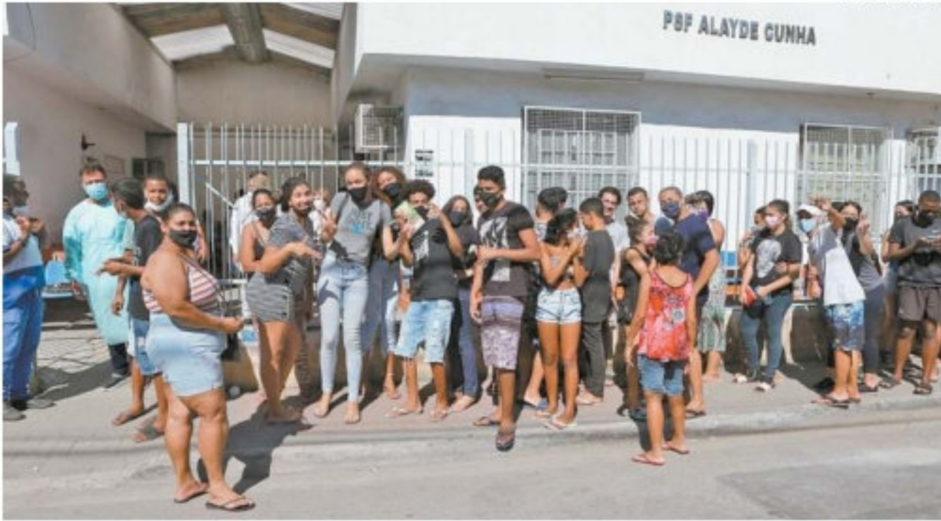
Adolescentes sem comorbidades não se vacinaram por não estarem no cronograma verdadeiro

Os adolescentes com deficiência - física, sensorial ou intelectual - devem apresentar documento que comprove - laudo médico, exame ou receita. Para esses jovens, a vaci-